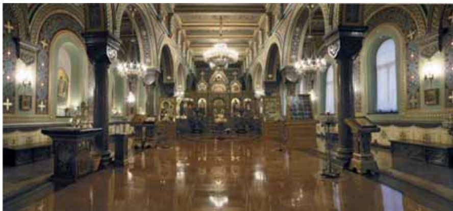
Интерьер храма прмч. Андрея Критского после реставрации

Семь лет продолжалась реставрация. По результатам в 2007 году она была признана одной из лучших реставраций исторического интерьера Санкт-Петербурга. 26 сентября 2006 года в храме во время завершения восстановительных работ побывал Святейший Патриарх Алексий II. 30 января 2007 года церковь открыли для верующих. 13 июня 2007 года церковь освящена митрополитом Санкт-Петербургским и Ладужским Владимиром. В 2007 году храм был приписан как городское подворье Константи-