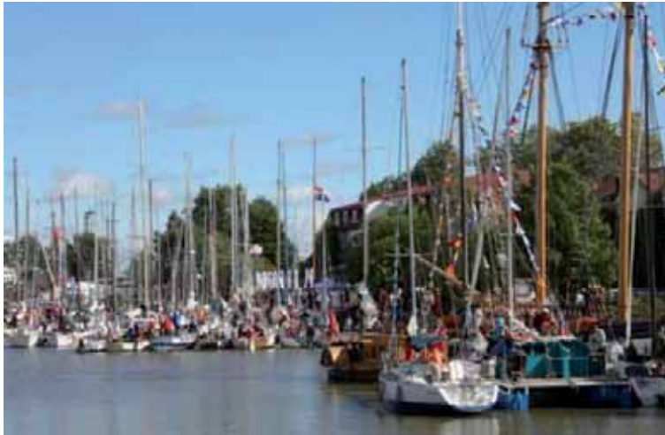
Парусные традиции Сидоровского канала сохраняет Ораниенбаумский морской фестиваль. Фото В. Журавлёва, 2015 г.

условия: залив, Сидоровский канал и яхтенный клуб, но нужна ещё и государственная поддержка. Тем более что уже с 2017 года в Генплане Санкт-Петербурга появилось зонирование, которое позволяет сделать территорию Сидоровского канала и рядом расположенной акватории — благоустроенной зоной отдыха жителей и гостей города, в том числе для занятий яхтенным спортом. Сохранение Сидоровского канала как места отдыха горожан, возрождение парусных традиций — все это очень важно для Ораниенбаума — города, стоящего на берегу моря.