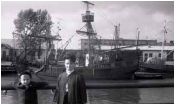
Ленфильмовский фрегат «Нева» в Сидоровском канале. 1960-е гг.

Парусная шхуна «Заря», стоявшая некоторое время среди других гидрографических судов в гавани Ораниенбаума,