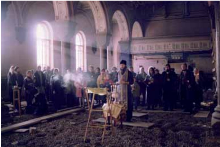
Молебен перед началом реставрации храма. Конец XX века

чальной росписи. Чудом сохранившаяся роспись сложного орнамента была в хорошей сохранности за исключением нескольких участков; их воссоздали по аналогии с общим рисунком. Около двух лет реставраторы открывали орнамент, покрывающий сплошным ковром стены, арки и потолок. Фрески превосходно сохранились, лишь немного потускнели. Реставрация проходила на научной основе в соответствии с архивными документами и чертежами. Высокое качество реконструкции отличает выполненные работы по изготовлению алтарных решеток, двух массивных паникадил, резного иконостаса, резных деревянных аналоев.