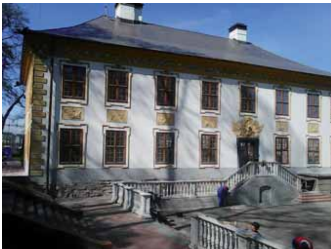
Летний дворец. 2011 г.