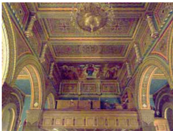
Роспись потолка над хорами «Покров Пресвятой Богородицы»

Особое внимание привлекает потолочная роспись храмового пространства над хором — живописная икона «Покров Пресвятой Богородицы».