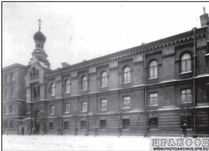
Здание Храма Андрея Критского. Фото начала XX века

Рижский проспект, дом 9 — здесь расположен один из красивейших храмов Санкт-Петербурга — церковь святого Андрея Критского. Здание храма размещается среди промышленного комплекса «главного печатного станка» страны. Первоначальные строения Экспедиции заготовления государственных бумаг (ныне Гознак) возведены по проекту Августина де Бетанкура, здесь — с 1818 до 1918 года изготавливались все бумажные деньги России. В 2018 году одно из старейших предприятий Санкт-Пе-