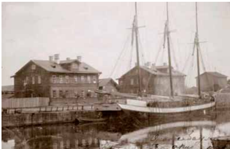
Гавань для стоянки яхт в Сидоровском канале. Почтовая открытка № 20, 1900-х годов.