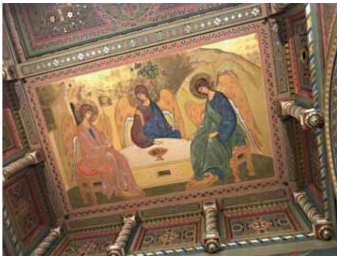
Роспись потолка в алтаре «Троица Новозаветная»

Семь лет продолжалась реставрация. По результатам в 2007 году она была признана одной из лучших реставраций исторического интерьера Санкт-Петербурга. 26 сентября 2006 года в храме во время завершения восстановительных работ побывал Святейший Патриарх Алексий II. 30 января 2007 года церковь открыли для верующих. 13 июня 2007 года церковь освящена митрополитом Санкт-Петербургским и Ладужским Владимиром. В 2007 году храм был приписан как городское подворье Константи-