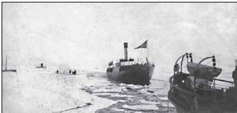
Новейшие на то время винтовые пароходы ледокольного типа «Луна» и «Заря» Ораниенбаумской паровой компании «Заря». Публикуется впервые

Следуя примеру Н. Г. Сидорова, «Ораниенбаумское паровое общество», которое с 1850 года осуществляло паровые перевозки из Кронштадта в Ораниенбаум, построило в 1889 году свой канал для паро-