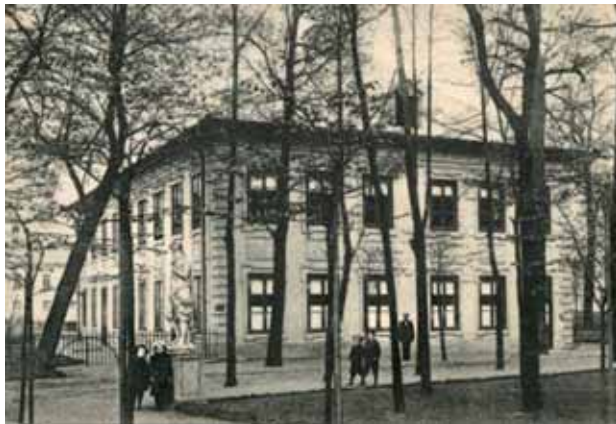
Летний дворец. Почтовая открытка 1915 г.

На одном ответственном совещании (хотя меня никто об этом не просил) я представил записку по поводу предстоящей реставрации Летнего дворца. Позднее получил ответ, что многие из моих предложений были приняты и, прежде всего, требование скрыть фальшивый цоколь, появившийся на фасадах в XX веке. Цоколь — это верхняя возвышающаяся над землей часть фундамента. Со временем с ростом, так называемого, культурного слоя подлинный цоколь частично или полностью скрывается под землей, и тогда, чтобы предотвратить фасад от загрязнения и механических повреждений цоколь увеличивают в высоту или делают новый, выше старого. В 1716 году с постройкой Невской набережной культурный слой у дворца вырос почти на 2 м. Уровень земли был поднят до дверных порогов, так что подлинный цоколь оказался глубоко под землей. А. Е. Ухналев предположил, что фальшивый цоколь был сделан в начале XIX века 10 . Но его нет не только на картинах с изображением Летнего дворца 1810-х — 1830-х годов, но и на почтовых открытках, выпущенных до 1902 года. Он зафиксирован на открытке 1915 года 11 .