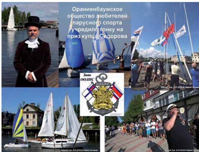
Яхтенная гонка на приз купца Сидорова. «Купец Сидоров» вручает победителю гонки главный приз — пивную кружку, которую победитель торжественно тут же выпивает. 2016–2017 гг.

спорта», которое в 2016 году учредило гонку в память купца Сидорова по регламенту гонок яхтсменов Сидоровского канала 1907 года. Главный приз — пивная кружка, из которой капитан яхты-победительницы может бесплатно пить пиво в ресторане отеля «Домик у причала» (одного из спонсоров гонки) в течение всего года. Устроители гонки заверяют, что всех участников этой регаты и в будущем ожидают веселые призы и затеи.