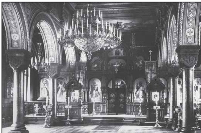
Храм Андрея Критского. Начало XX века