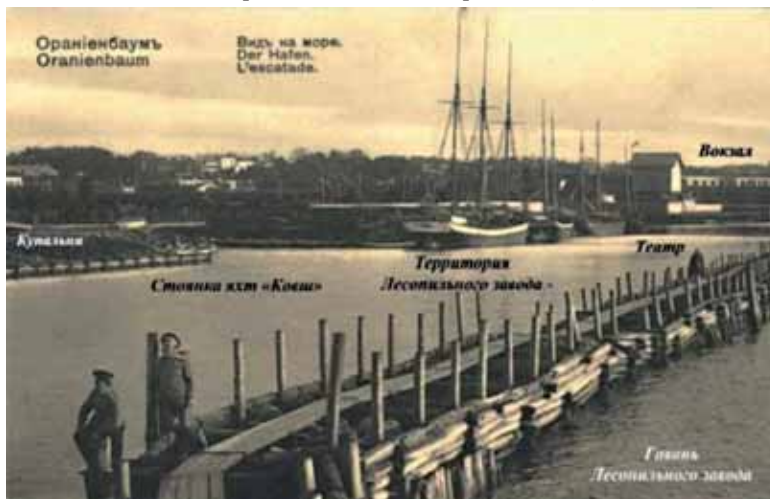
Сидоровский канал. Почтовая открытка 1915 г.