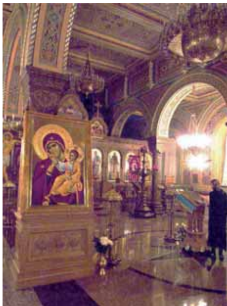
Икона «Отрада и Утешение»

украшенных ковчежцах находятся частицы мощей: Елисаветы и Захария — родителей Иоанна Предтечи; святых Кирилла и Мефодия; апостола Варфоломея — одного из двенадцати; Николая Мирликийского, Спиридона Тримифунтского; равноапостольных царей Константина и Елены; Георгия Победоносца; Иоанна Дамаскина; Димитрия Солунского; Пантелеимона Целителя; Марии Египетской и Зосимы; Веры, Надежды, Любви и Софии; великомученицы Варвары и Татианы; Матроны Московской.