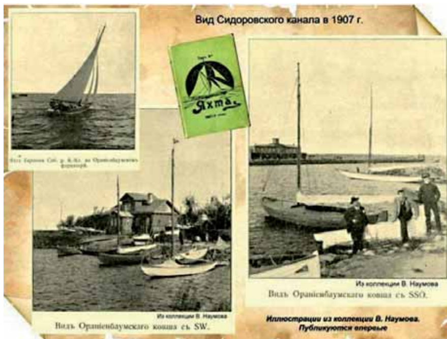
Иллюстрации из журнала «Яхта» 1907 г. Публикуется впервые