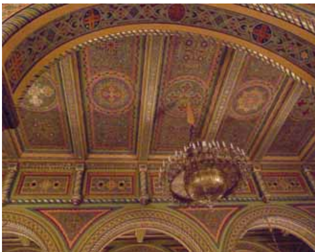
Роспись потолка храма после реставрации и паникадило