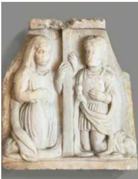
Святые равноапостольные царь Константин и мать его царица Елена. Горельеф. Европа. XII век. Мрамор.

де всего — это святые. Музей и храм — редкое сочетание единого церковного организма. В дни памяти святых, иконы которых в храме отсутствуют, из музея их перемещают в храм. Возможно, в Санкт-Петербурге это единственный опыт сопряжения церкви и музея в одном здании.