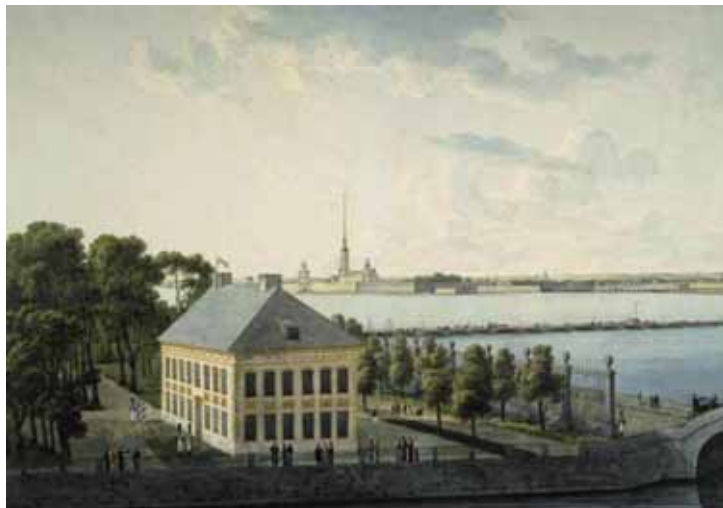
А. И. Мартынов. Летний дворец. 1810-е гг.

крашивать здания, чтобы напомнить, как они выглядели в тот или иной период своей истории. Во времена Петра побелка зданий применялась не реже, чем окраска в желтый и красный цвет 7 . Летний дворец оставался белым на протяжении, по крайней мере, 150 лет. Но не следует говорить, что изначально дворец был белым, и подвергать сомнению правомерность решения А. Э. Гессена о возвращении ему исторической окраски в желтый цвет. К сожалению, именно это мы сейчас и слышим.