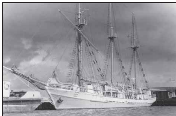
Научно исследовательское судно Академии наук СССР — маломангнитная шхуна «Заря». Публикуется впервые.

А с парусными судами Ораниенбаум не расстался и после войны. Курсанты Ломоносовского мореходного училища, как и курсанты других морских училищ, проходили практику на учебных парусных судах, таких как «Чайка» или на маломангнитной шхуне «Заря». Несколько слов о судьбе этого уникального судна.