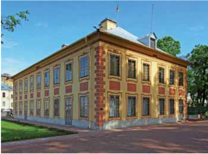
Летний дворец. Раскрыт фальшивый цоколь. 2002 г.

ремонте фасадов дворца его раскрыли. При этом, решив, что выветренный от времени известняковый цоколь не достаточно красив, его отшлифовали! В начале XX века при устройстве фальшивого цоколя были снесены угловые кирпичные русты. А. Э. Гессен восстановил русты в штукатурке, и, так как это — «новодел», многоопытный архитектор намерено придал им гладкую поверхность (подлинные русты выполнены «в шубе»). «Реставраторы» (приходится применить кавычки) раскрыв цоколь, сохранили на нем новодельные русты.