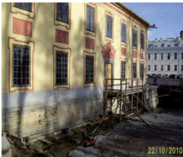
Летний дворец. Южный фасад, обнаженный до уровня фундамента