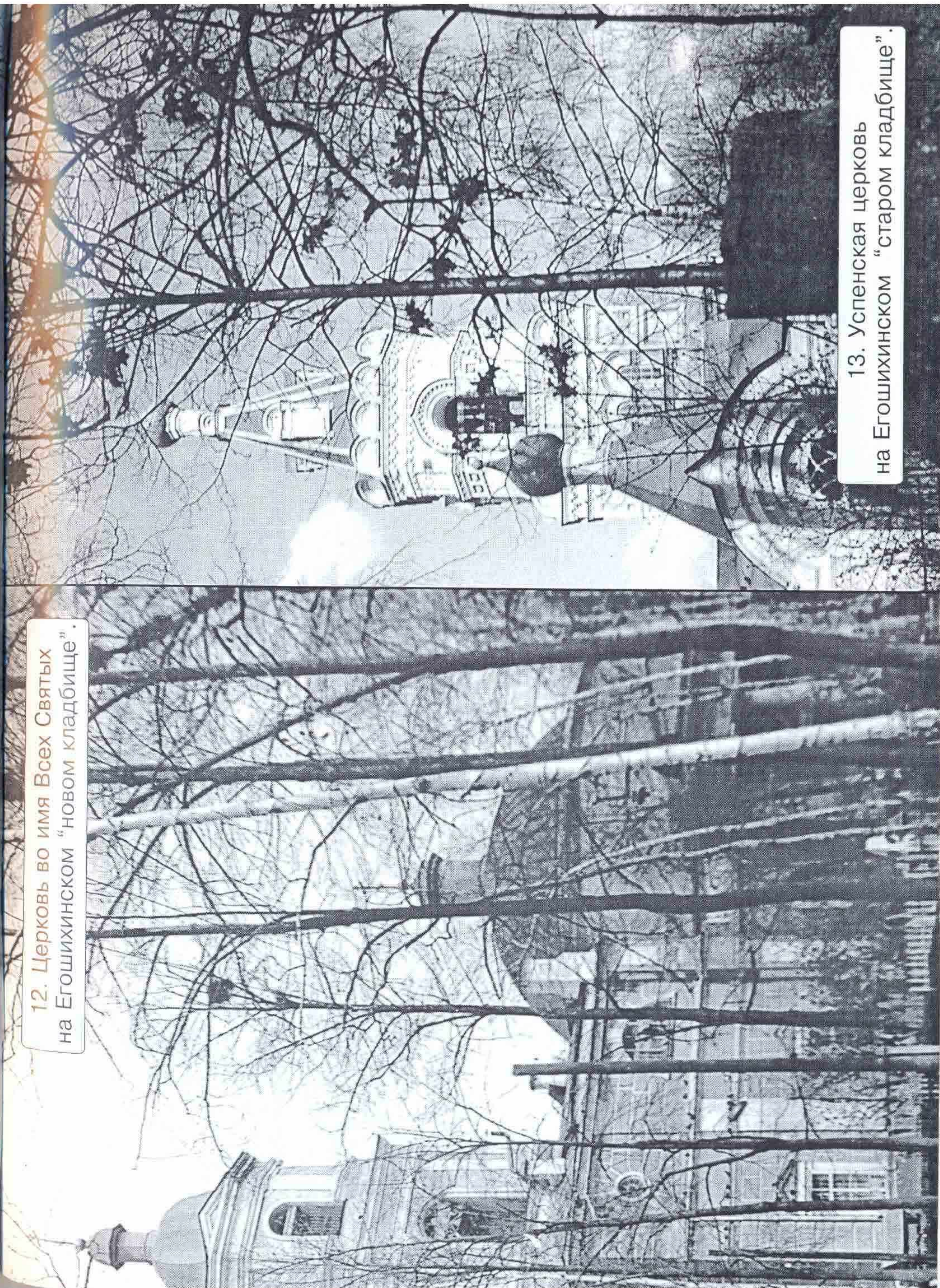
12. Церковь во имя Всех Святых на Егошихинском "новом кладбище".