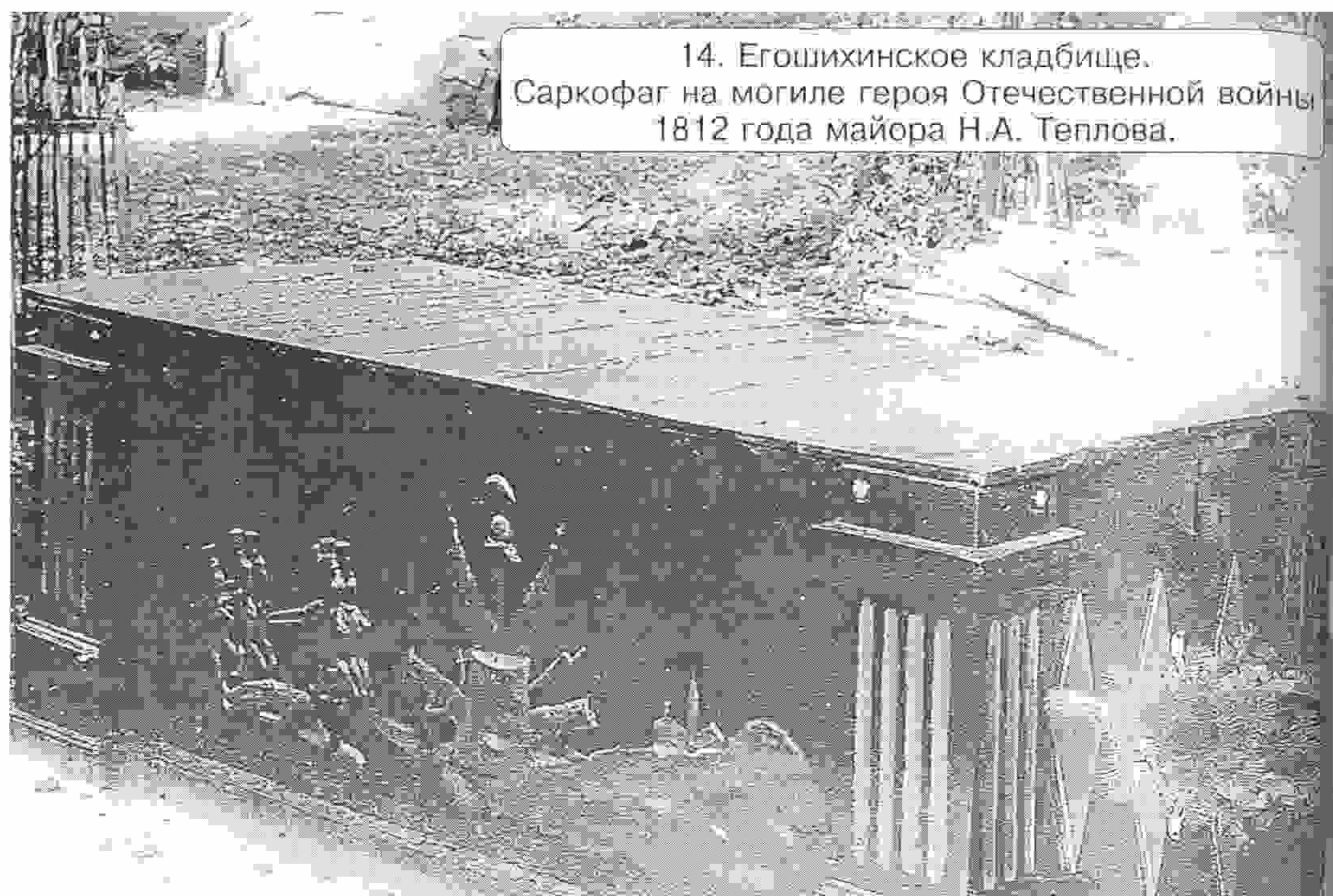
14. Егошихинское кладбище. Саркофаг на могиле героя Отечественной войны 1812 года майора Н.А. Теплова.