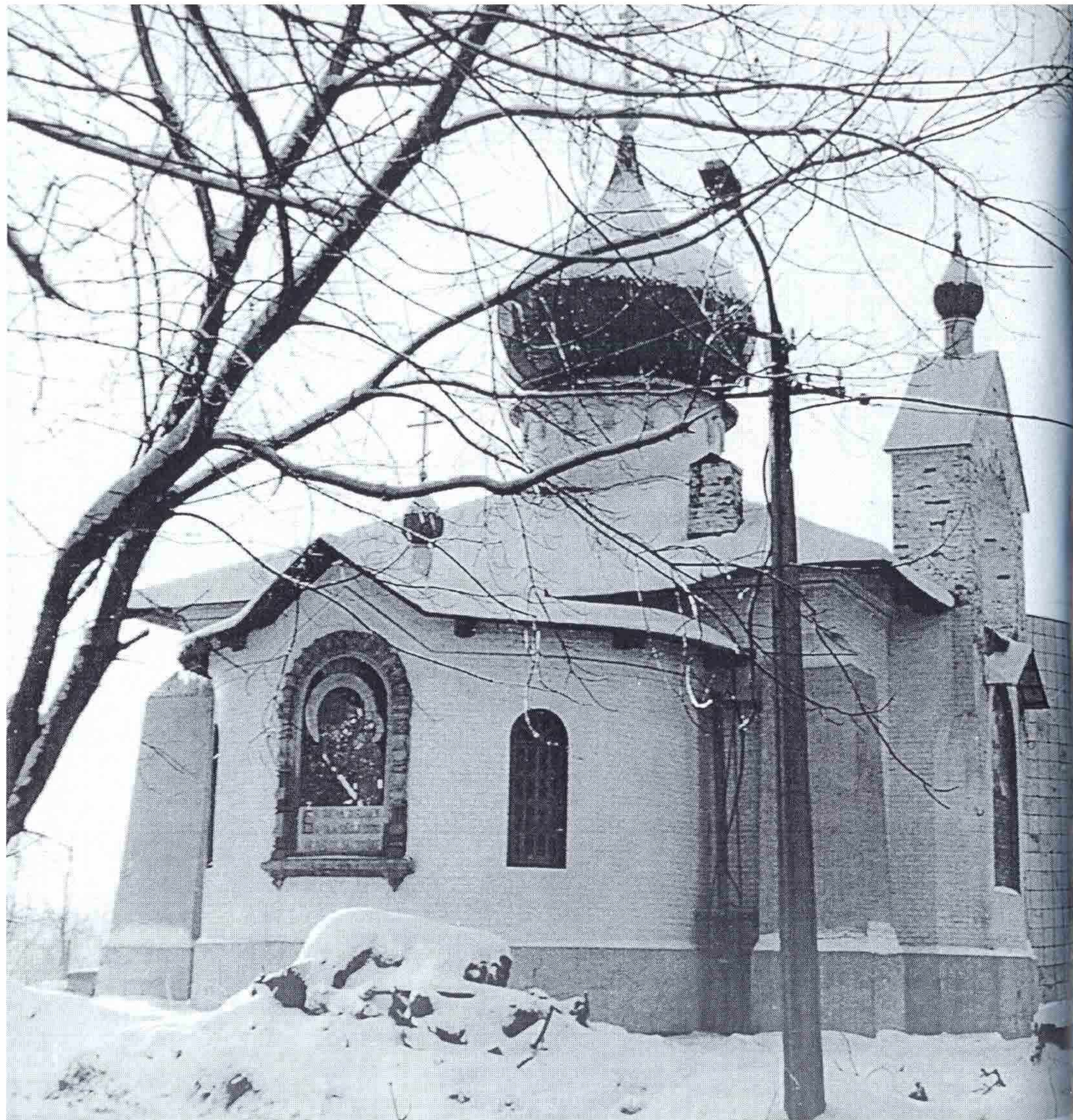
11. Церковь Иконы Казанской Божией матери Успенского женского монастыря (после реставрации)