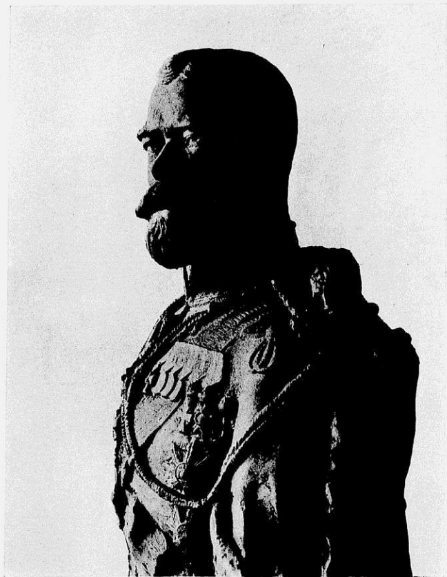
Восьь Его Императорскаго Величества Государя Императора Николая Александровича, работы акад. Кустодіева, по заказу бывшихъ лицействоъ.

Съ этого бюста воспроизведено мраморное изваяніе Его Величества — ближайшій подарокъ Лицею бывшихъ его воспитанникоъ.