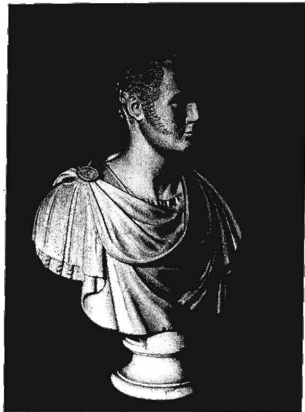
Мраморный бюст Государственного Орденов Лидия.

Образный подарок Лидия Бюстница мраморная.